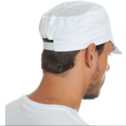
L505 11 Berretto uomo HACCP