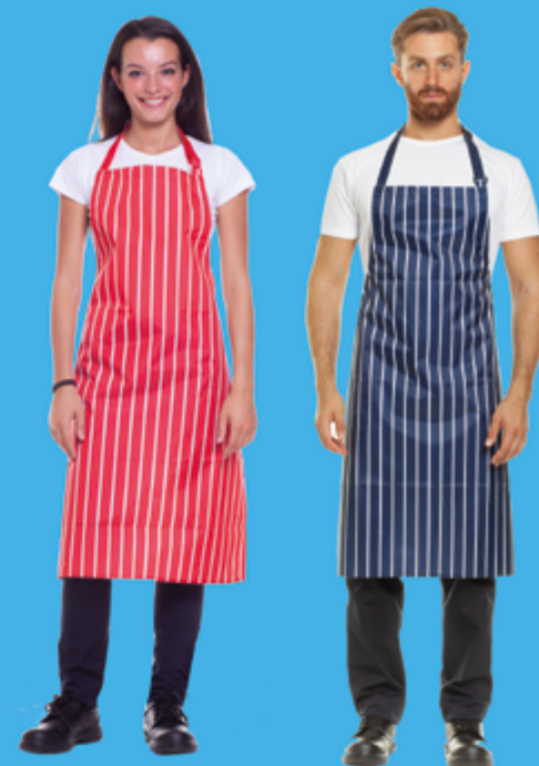
L523 Grembiule in nylon Misura Unica cm 95x73

Finitura in tessuto resistente all'acqua, le gocce d'acqua si allontanano dalla superficie del tessuto