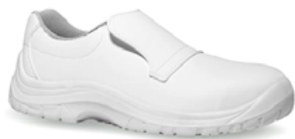
BC023 Scarpa bassa S2 SRC