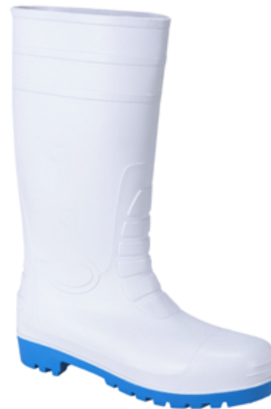
BC012 Stivale Bianco SRCS5