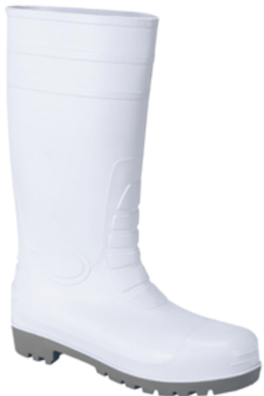
BC029 Stivale Bianco SRCS4