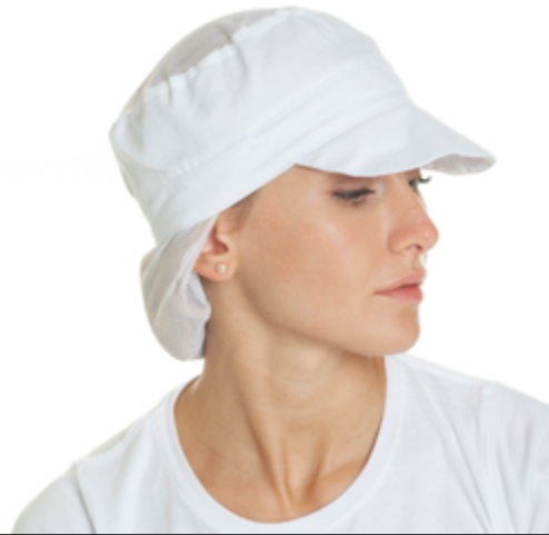
L504 11 Berretto donna HACCP