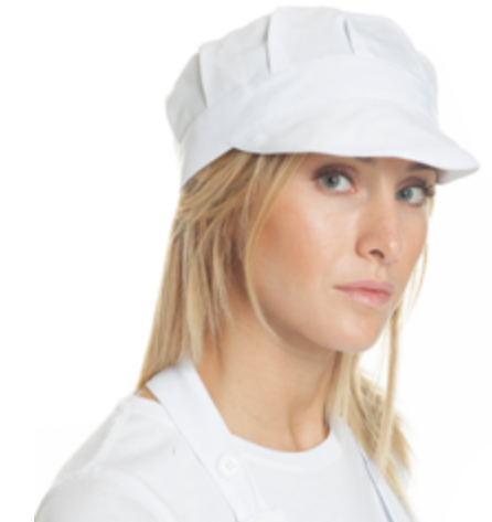
L004 11 Berretto con visiera