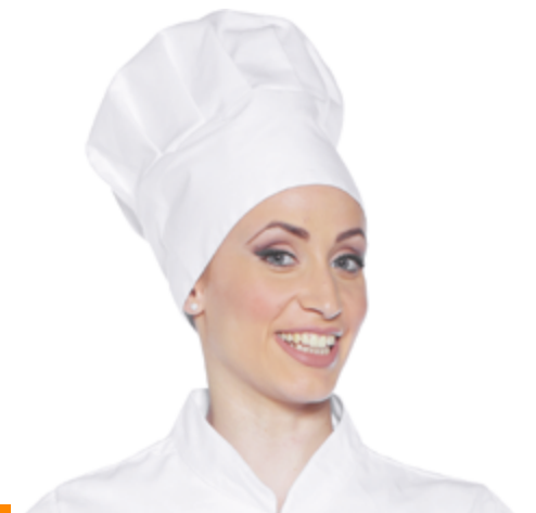
L010 11 Cappellino cotone HACCP