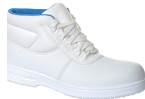
BC011 Scarpa alta S2