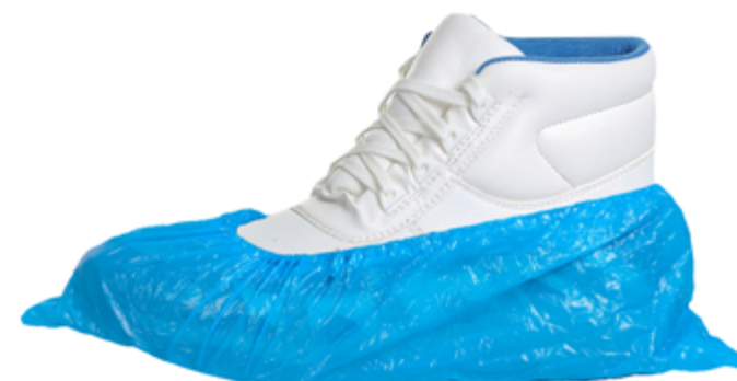
BC141 Sopra scarpe monouso

Taglie Unica - Si vende solo a confezioni da 100 pezzi