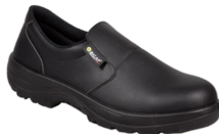
BC125 Bianca - BC127 Nera Scarpa bassa S2 SRC