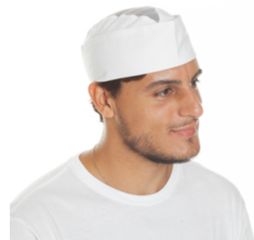
L025 11 Berretto uomo HACCP