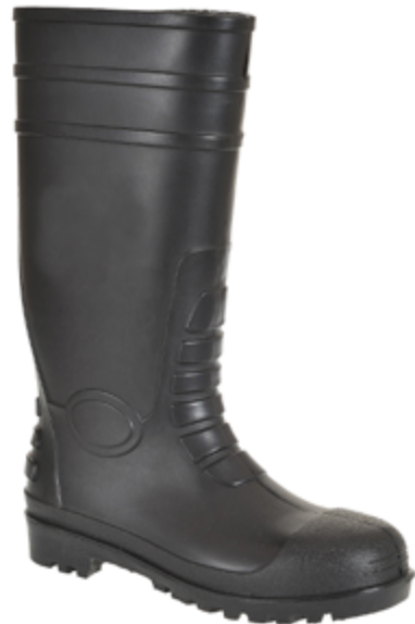
BC013 Stivale Nero SRCS4