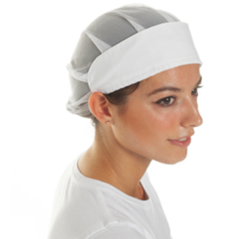
L005 1111 Cuffia donna HACCP