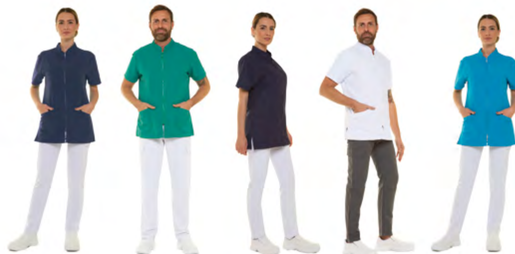
01 Blu Navy